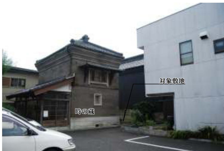
北東方向より対象敷地を撮影