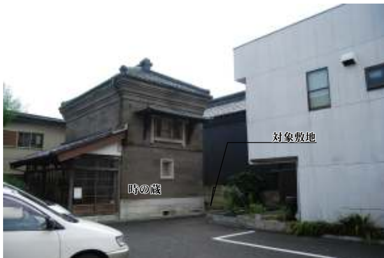
北東方向より対象敷地を撮影